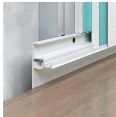
F1.3028L12W — malowany na kolor biały* (RAL 9003 matowy)