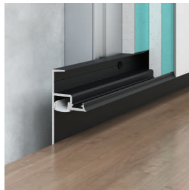
F1.3028L12B — malowany na kolor czarny* (RAL 9005 matowy)