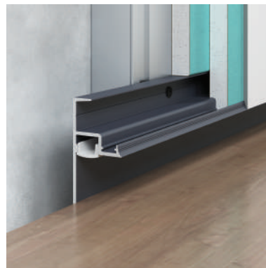
F1.3028L12R — dowolny kolor* wg palety RAL