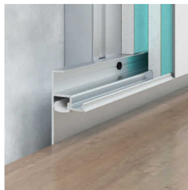
F1.3028L12 — bez powłoki